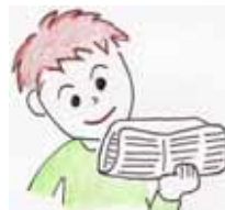
新聞・牛乳配達員