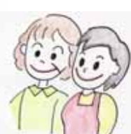
民生委員・近所の人